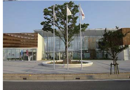
会場のピアラシティ交流センター