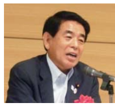
基調講演する下村博文 文部科学大臣・パネル ディスカッションにも参加